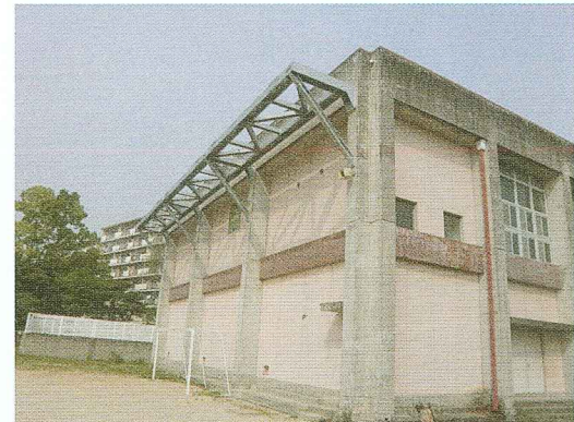
一丘小体育館の耐震化

東南海地震などにそなえて、2014年までに小・中学校、幼稚園を耐震化されることになりました。