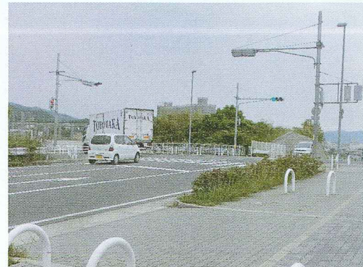
設置された信号機

市民の要望の強かったJR尋春橋と砂川・榎井線の交差点に信号機の設置を実現しました。