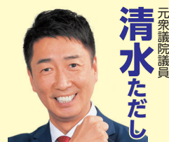
元衆議院議員 清水 ただし