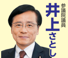
参議院議員 井上 さとこ