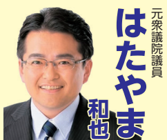
元衆議院議員 はたやま 和也