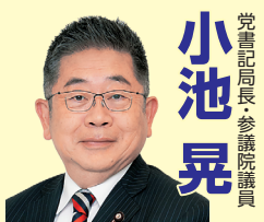
党書記局長・参議院議員 小池 晃