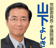
党副委員長・参議院議員 山下 よしき