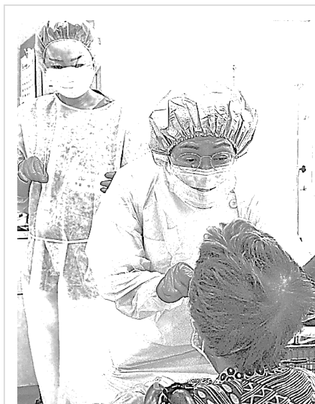
検体を採取する医師＝看護師、東京都

PCR検査の抜本拡充によって、陽性者の保護・隔離を徹底的に行うとともに、地域・業種を限定した休業要請を補償とセットで行うことで、感染急拡大に歯止めをかけていくことが必要です。